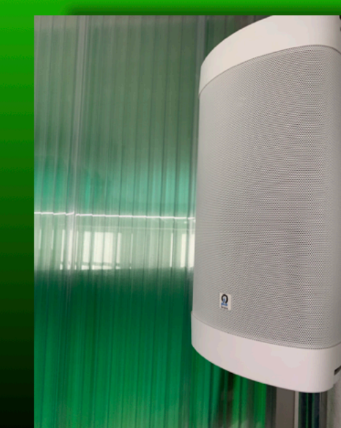
Da sinistra: la sala conferenza nella sua interezza; il telecomando Pro Control; la cassa acustica Origin Acoustics